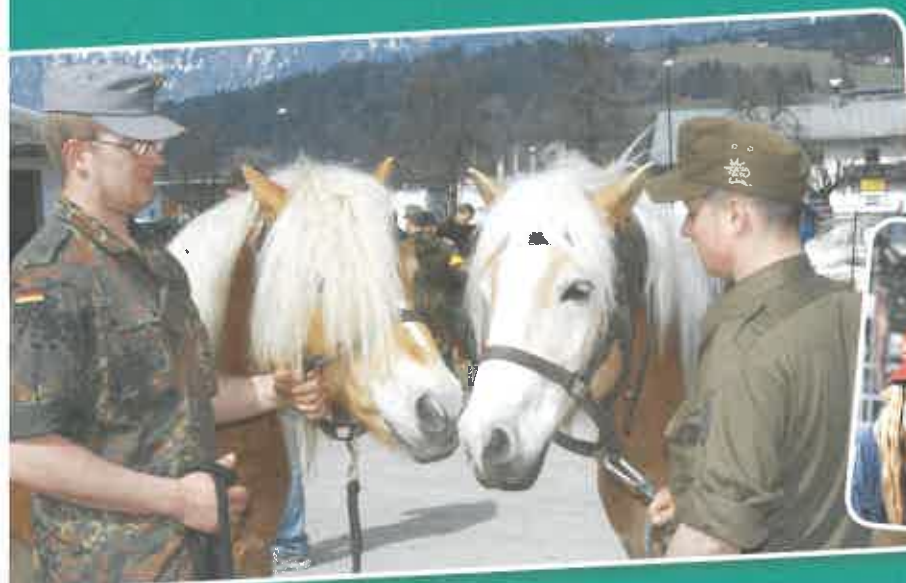
Beim Bundesheer arbeiten auch Tiere. Haflinger-Pferde werden etwa zum Tragen eingesetzt

es alles kann. Am 23., 24. und 27. Oktober (jeweils 10 bis 17 Uhr) wird beim Burgtheater und auf dem Heldenplatz für deine Unterhaltung gesorgt. Am Nationalfeiertag sprechen um 10.30 Uhr auf dem Heldenplatz junge Soldaten und Soldatinnen über ihre Arbeit.